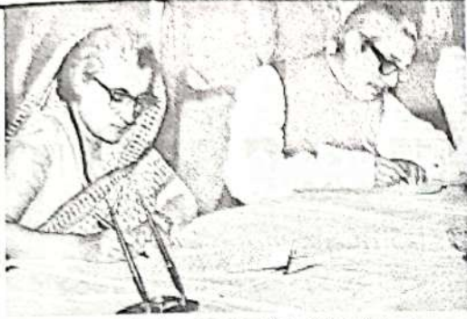
১৯৭৪ সালে বাংলাদেশ-ভারত সীমান্ত চুক্তি স্বাক্ষর করেন বঙ্গবন্ধু ও ইন্দিরা গান্ধী